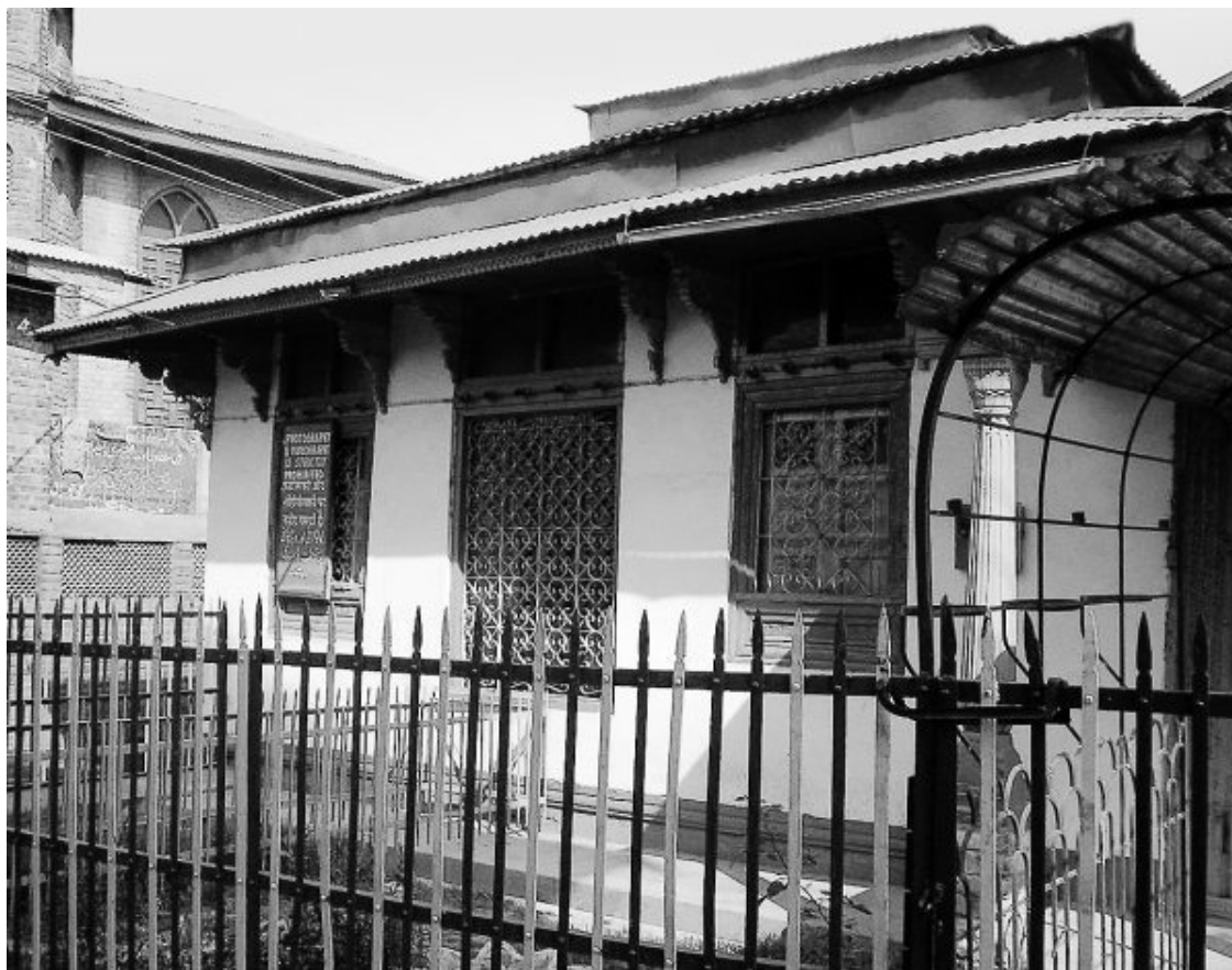
Илл. 8. Розабал – «могила Иисуса» в Шринагаре, Индия

Что доказывает эта гипотеза? Ровным счетом ничего. Индийская цивилизация гораздо древнее европейской. Веды написаны задолго до рождения Иисуса. Буддизм моложе Вед, но и его возникновение отделено от христианства пятью столетиями. То же можно сказать о религии Зороастра, который умер не менее чем шестью веками раньше, чем родился Иисус (некоторые источники говорят даже о десяти веках). Иисус никак не мог оказать влияние ни на ведийский брахманизм, ни на буддизм, ни на зороастризм. Тогда, может быть, наоборот, он почерпнул свое учение из этих древних источников? Этого тоже быть не могло, ведь он выступил со своей проповедью до, а не после того, как (следуя рассматриваемой гипотезе) оказался на Востоке. То есть, создавая свое учение, он еще не был знаком с религиями Индии и Ирана.