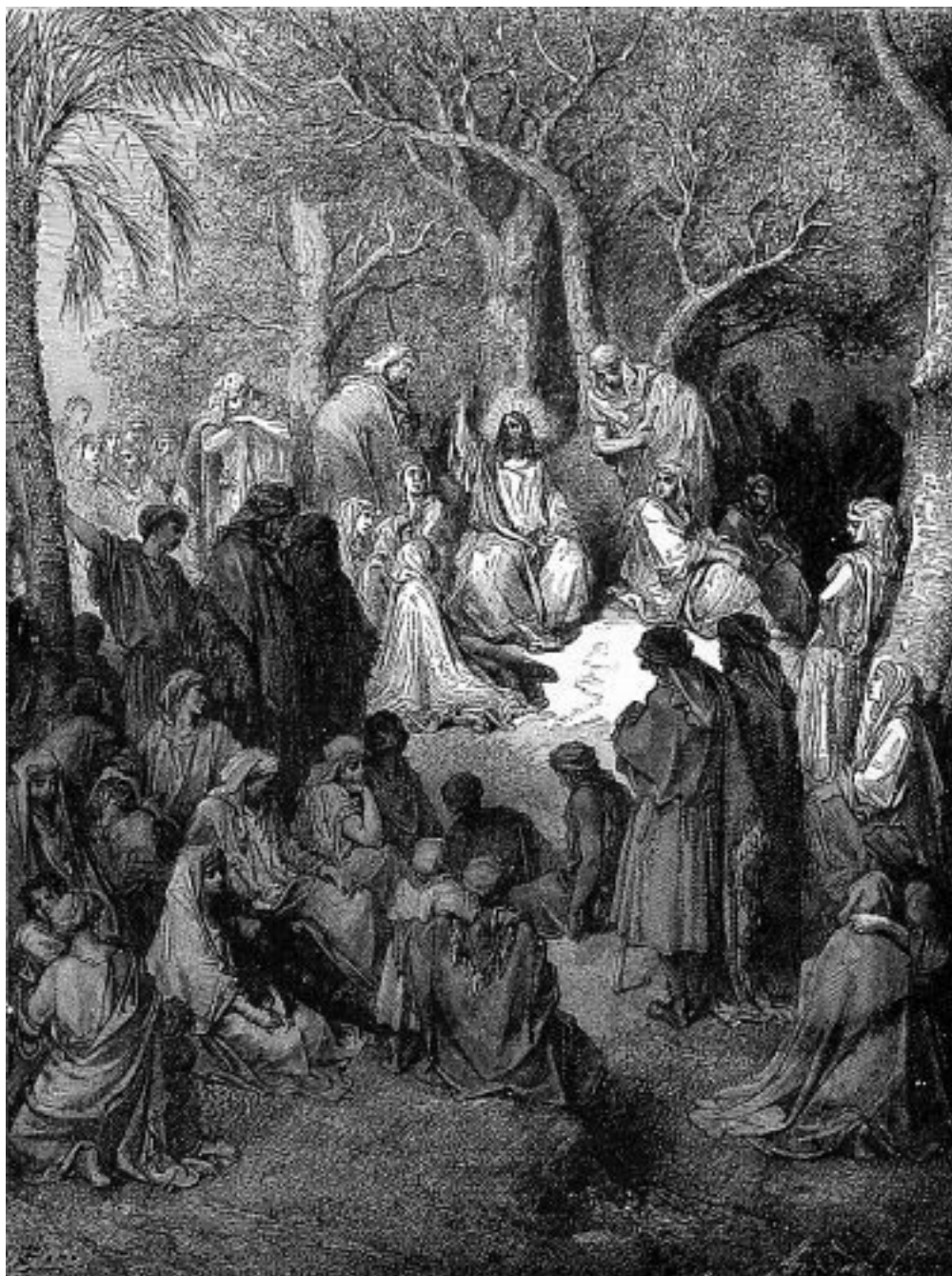
Илл. 4. Нагорная проповедь Иисуса

И еще дальше на Востоке, уже на самом краю Ойкумены, в трактатах мудрецов Древнего Китая мы обнаружим те же слова. «Мудрый человек действует без насилия и никому ничем не вредит», 8 – записал Лао-цзы (предположит. 604–517 гг. до н. э.) в «Книге о Дао и дэ». А в трактате Конфуция (551–479 гг. до н. э.) встречается уже совершенно идентичная формулировка: «Цзы Гун спросил: как в немногих словах выразить принцип, которым можно руководствоваться всю жизнь? Учитель ответил: „Не делай другим того, чего не пожелаешь себе“» 9 .