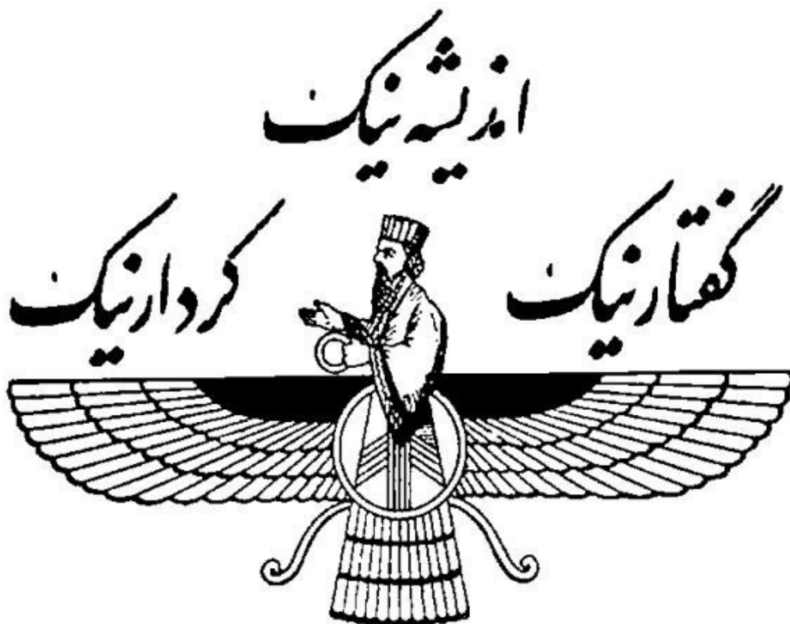
Илл. 7. Три принципа благой жизни зороастризма

Тот факт, что в разных культурах, связь между которыми на том этапе маловероятна и во всяком случае никак не удостоверена не ведавшими друг о друге мыслителями, один и тот же принцип формулируется схожим, практически одинаковым образом, не может не вызывать удивления!