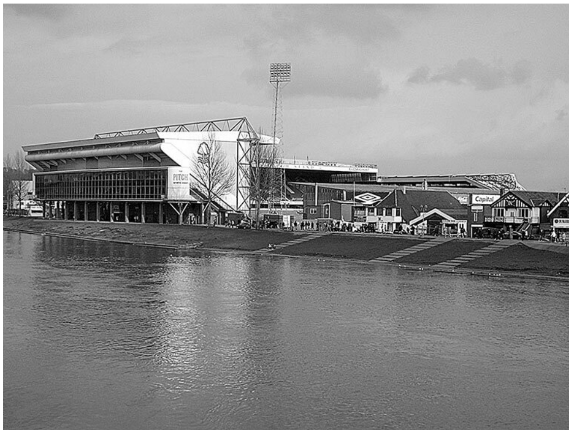
Стадион «Сити Граунд» – домашняя арена «Ноттингем Форест»