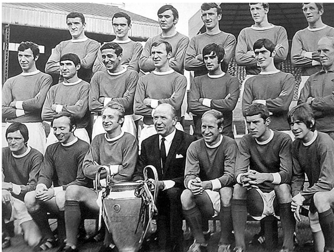
«Манчестер Юнайтед» в 1968 г.

Обескровленный «Манчестер» не смог продолжить борьбу за Кубок европейских чемпионов. Вдобавок вновь проиграл в том трагическом 1958 году Кубок Англии, уступив в финале клубу «Болтон Уондерерс» – 0:2. Потерял «Манчестер» и чемпионский титул – в сезоне 1957–1958 годов первенствовал клуб «Вулверхэмптон». Великому тренеру Мэтту Басби пришлось, по сути, создавать команду заново – причем уже во второй раз. В первый раз он начинал делать это еще в 1945 году, когда возглавил «Манчестер Юнайтед».