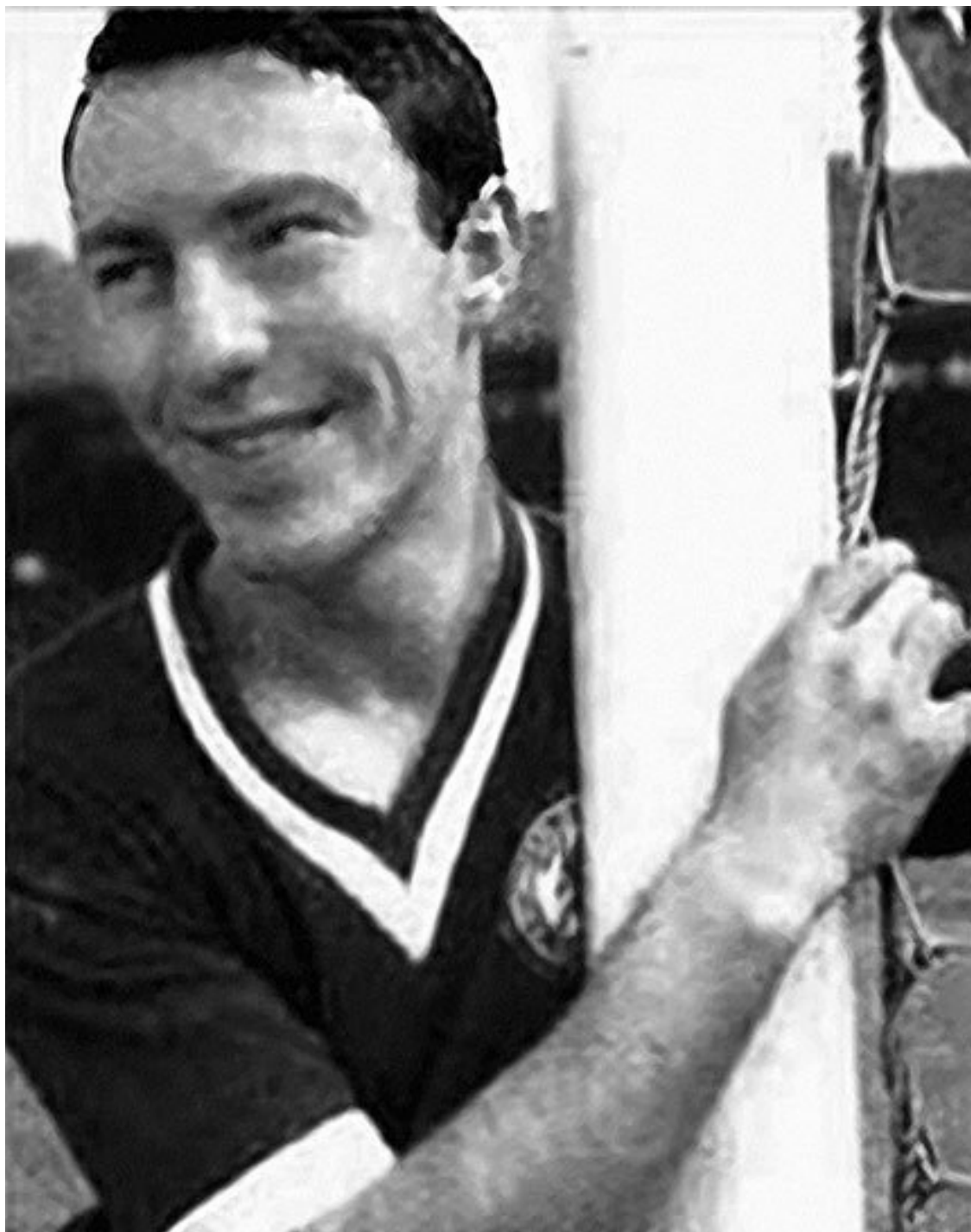
Джимми Гривз играл за «Тоттенхэм Хотспур» 7 сезонов

История основания этого клуба сходна с историей «Астон Виллы» и «Эвертона» – «Тоттенхэм Хотспур» тоже был основан игроками в крикет, на этот раз учениками одной из лондонских школ. Это случилось в 1882 году, но первый успех пришел только в 1900 году – «Тоттенхэм» выиграл Кубок южной лиги, как тогда назывался один из низших дивизионов. А в следующем году «Тоттенхэм Хотспур» дошел до финала Кубка Футбольной ассоциации, где ему противостоял «Шеффилд Юнайтед», уже завоевывавший этот трофей двумя годами раньше и успевший также побывать чемпионом Англии. Новичок «Тоттенхэм» оказался дерзким. Первый финальный матч потребовал дополнительного времени, но все равно завершился