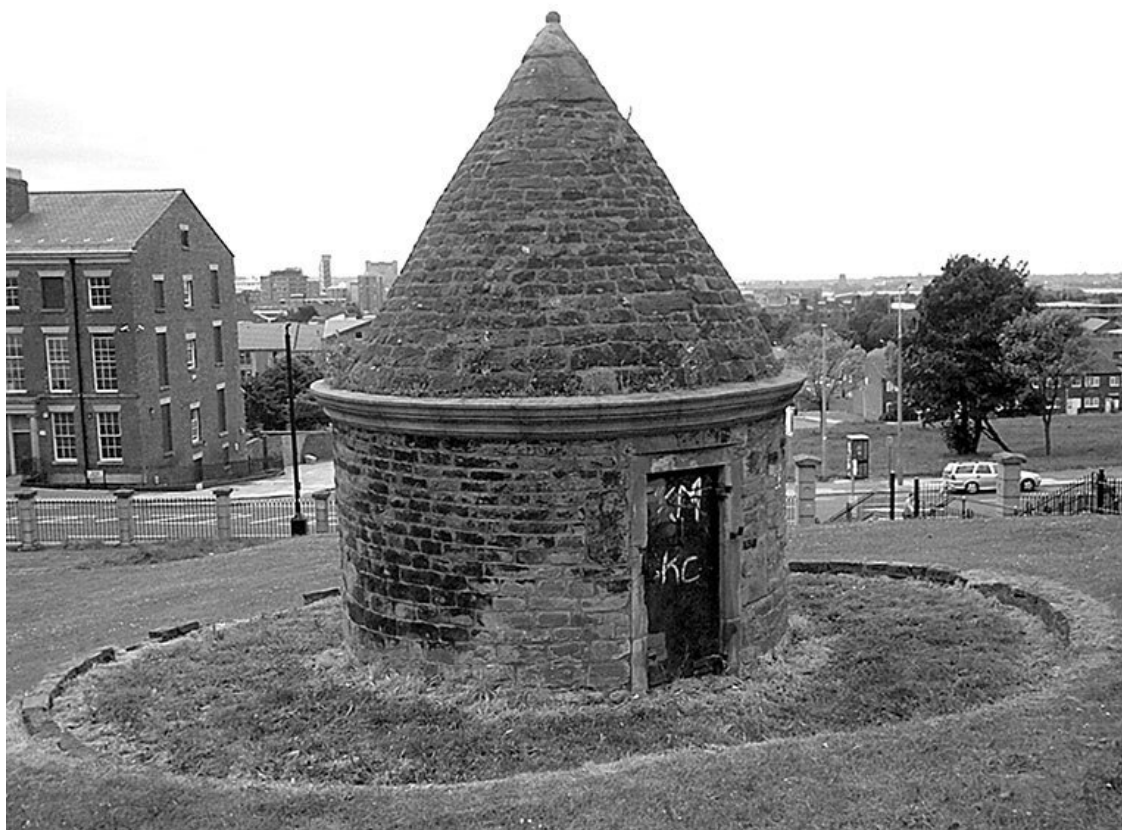
Башня Принца Руперта, ставшая эмблемой «Эвертона»