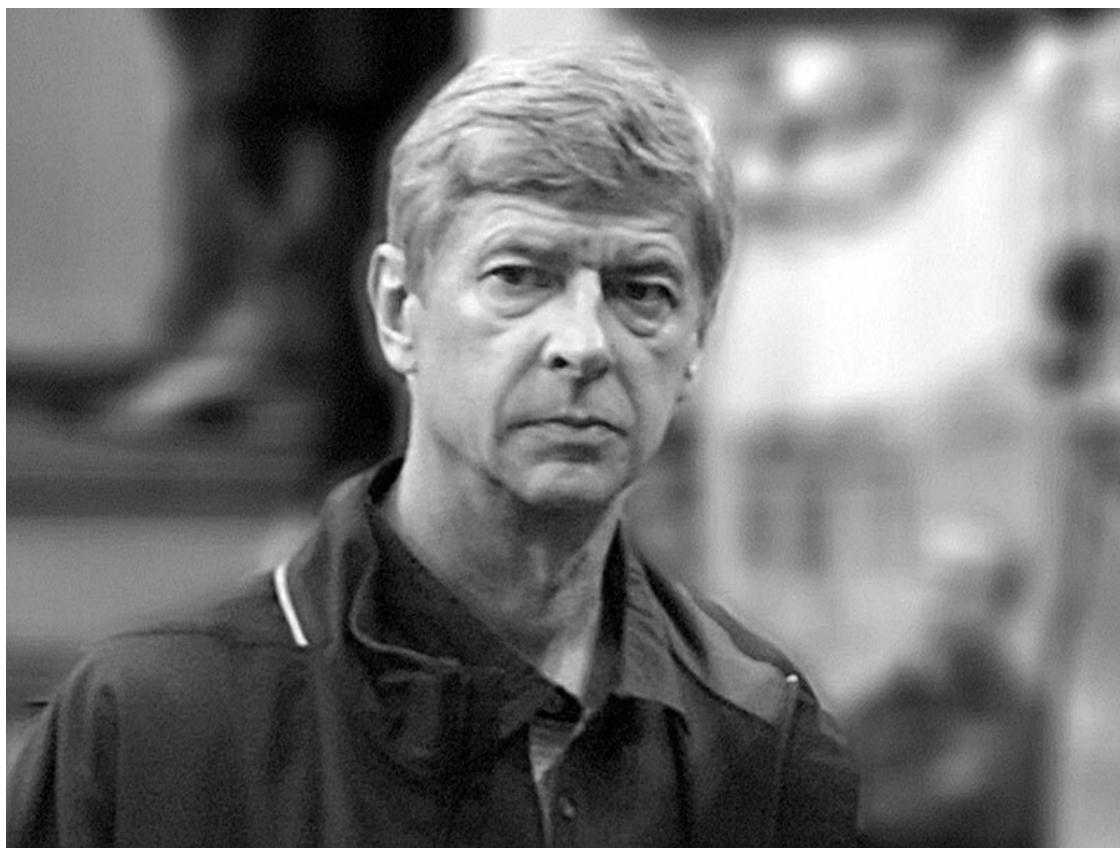
Тренер «Арсенала» Арсен Венгер

В 2000 году «Арсенал» дошел до финала Кубка УЕФА, где проиграл в серии пенальти турецкому «Галатасараю». В 1995 и 1980 годах лондонский клуб играл в финалах Кубка обладателей кубков, но уступил, соответственно, «Сарагосе» со счетом 1:2 и «Валенсии» – опять-таки в серии пенальти. В 1994 году «Арсенал», правда, выиграл этот же Кубок обладателей кубков, одолев в финальном матче итальянскую «Парму» со счетом 1:0, но в том же году проиграл матч за Суперкубок УЕФА другому итальянскому клубу – «Милану». Так что единственный Кубок обладателей кубков, да еще Кубок ярмарок, выигранный в далеком уже 1970 году, пока так и остаются единственными международными трофеями «Арсенала».