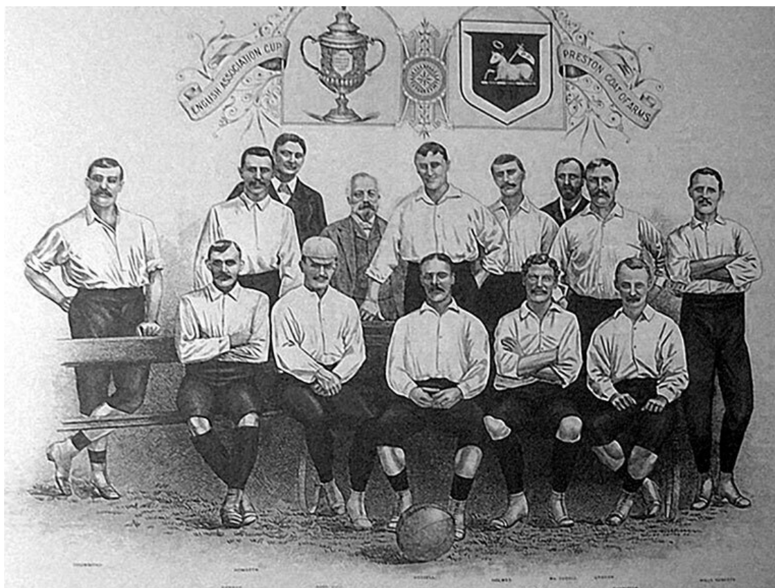
Команда «Престон Норт Энд» на открытке конца XIX в.

Однако футбол уже превращался в доходное предприятие. Зрители стали платить за билеты на матч, и чем интереснее матч, тем больше был сбор. Интерес же к матчу подогревался именно участием в нем первоклассных игроков. Неудивительно, что хозяева многих клубов смотрели на запрет Футбольной ассоциации сквозь пальцы и действительно платили футболистам за игру.