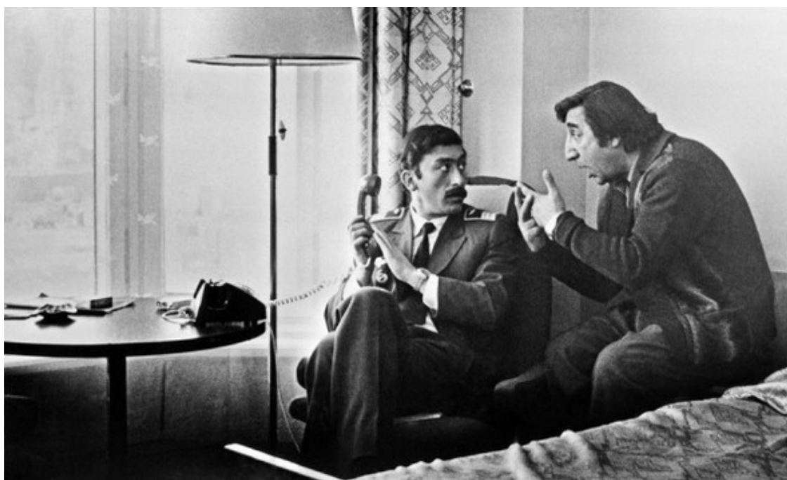
«Мимино», 1977. Авторы: режиссер и сценарист Георгий Данелия; сценаристы Резо Габриадзе и Виктория Токарева; композитор Гия Канчели

Советская стужа была по-своему уникальной. Люди укрывались от коммунистического официоза в частной жизни. Людям искусства приходилось особенно трудно. Им ничего не оставалось другого, как бежать в искусное ремесло. И просто – в мастерство.