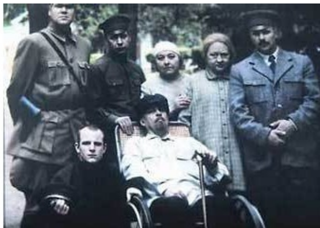
«Телец», 2000. Авторы: режиссер Александр Сакуров; сценарист Юрий Арабов; композиторы Андрей Сигле и Сергей Рахманинов

Ленин в «Тельце» на краю своей брэнной жизни не знает никаких нравственных мук и угрызений совести; его мука и отчаяние от того, что его оставил рассудок. Тот самый, что был стержнем его деятельного реформаторства. Того самого, которому он пытался подчинить весь мир.