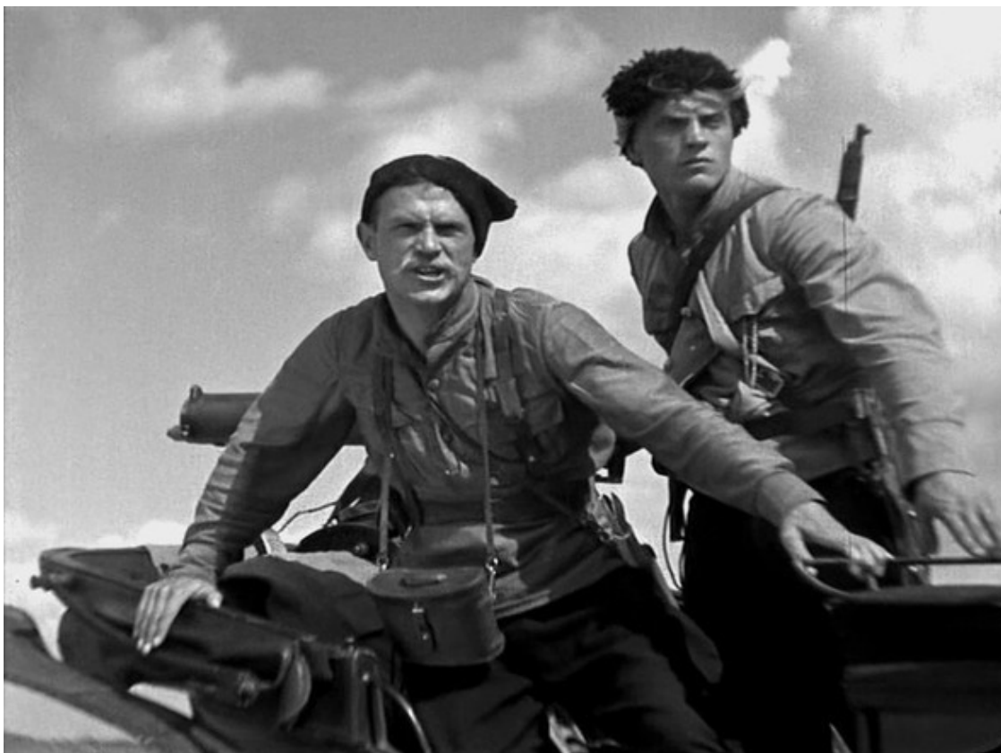
Чапаев (Борис Бабочкин), Петька (Леонид Кмит), «Чапаев», 1934. Авторы: режиссеры и сценаристы Георгий и Сергей Васильевы; сценаристы Анна Фурманова, Дмитрий Фурманов; композитор Гавриил Попов

Именно при Сталине – и, кажется, по образцу, им представленному – сложилась система редакторского сопровождения каждого снимающегося на советских киностудиях произведения. В аппарате не только каждой из киностудий, но и Госкино (или киноглавка, когда кинопроизводство входило в структуру Министерства культуры СССР) был немалый штат редакторов, которые курировали производство каждой ленты, – от темплана до чистового монтажа готового фильма, осуществляя, наряду с профессиональными функциями, откровенно-цензурные, позволяющие не пропустить сквозь сито требований и замечаний что-либо, похожее на инакомыслие.