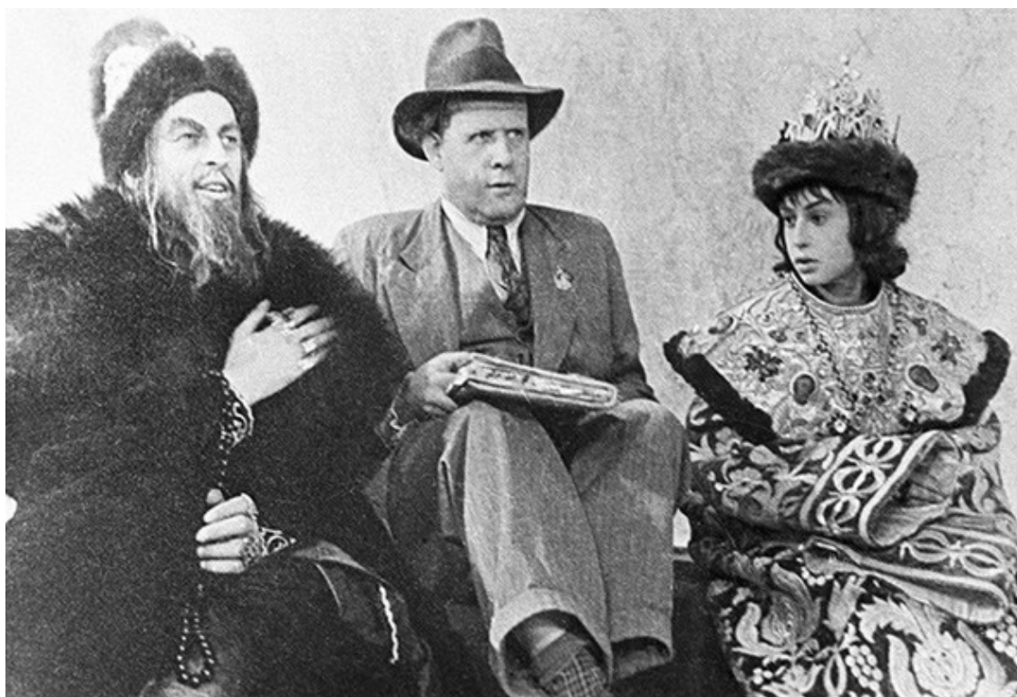
«Иван Грозный», 1944. Авторы: режиссер и сценарист Сергей Эйзенштейн; композитор Сергей Прокофьев

Верховный мифотворец с большим удовлетворением отсмотрел первую серию фильма. Ту, где молодой, энергичный царь, не ведая сомнений и колебаний, не советуясь с совестью, утверждался на престоле ценой беспримерной жестокости.