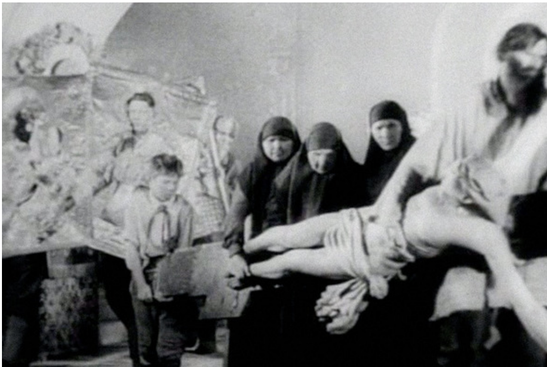
«Бежин луг», 1935. Авторы: режиссер и сценарист Сергей Эйзенштейн; сценаристы Исаак Бабель, Александр Ржешевский, Иван Тургенев; композитор Гавриил Попов

снятый по сценарию Александра Ржешевского, Эйзенштейна сначала унизили, запретив его «Бежин луг» и заставив его каяться в допущенных там мнимых ошибках, а затем довели до инфаркта, ставшего для него роковым, объявив вторую серию «Грозного» грубой политической ошибкой, удостоенной разного Постановления ЦК партии.