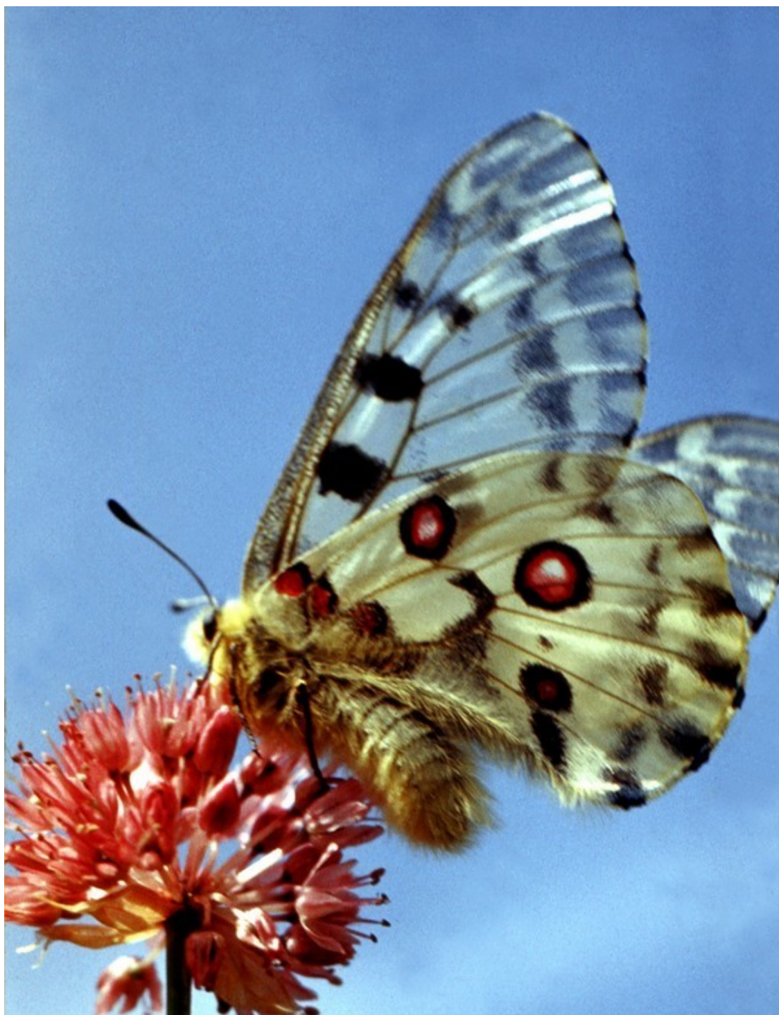
Аполлон – Parnassius Apollo L. Занесен в Красную книгу СССР

Аполлон – бог искусства, а также бог света, покровитель искусств в древнегреческой мифологии.