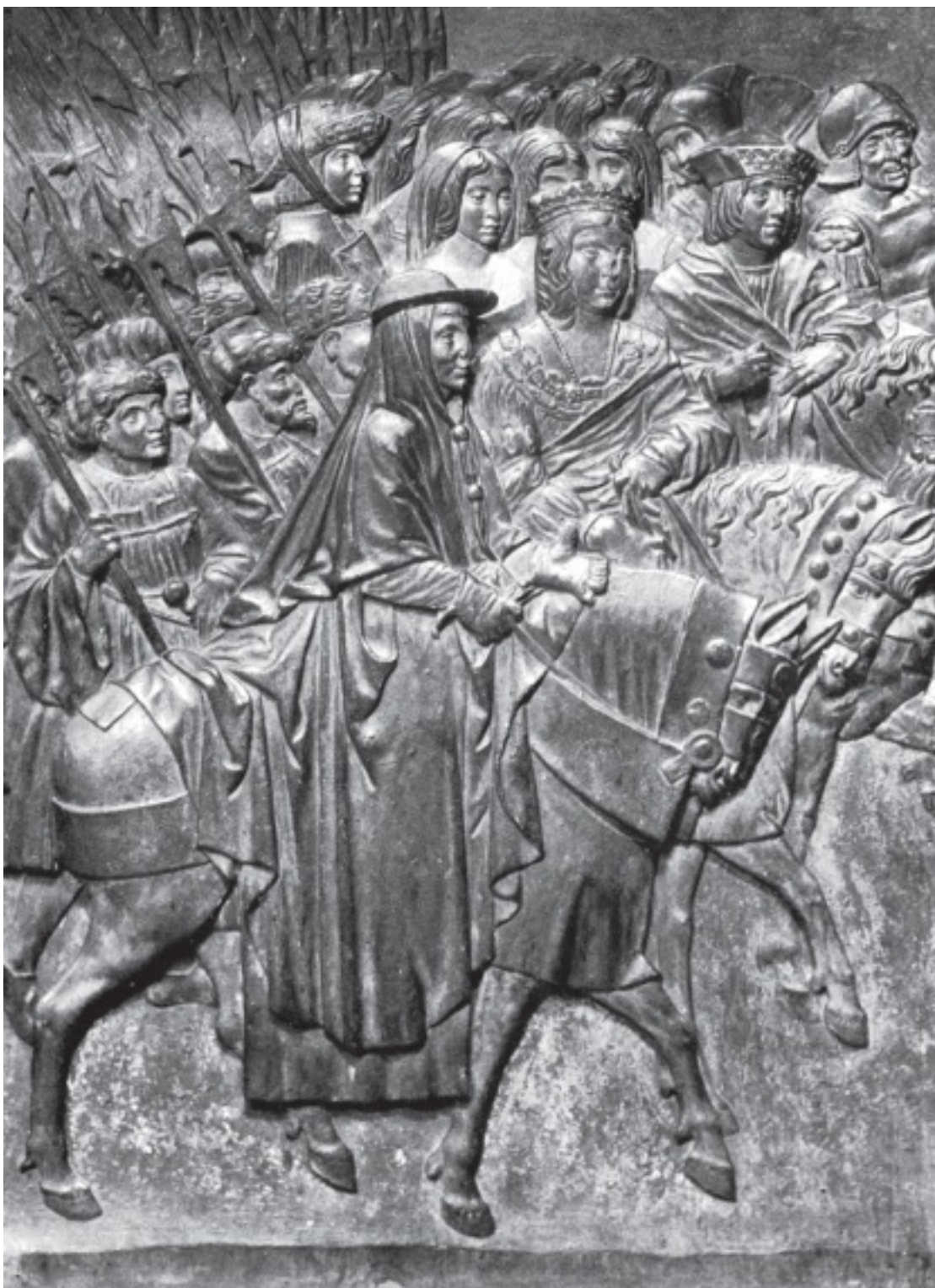
Фердинанд и Изабелла вступают в Гранаду после победы над маврами. Барельеф, XVI в.