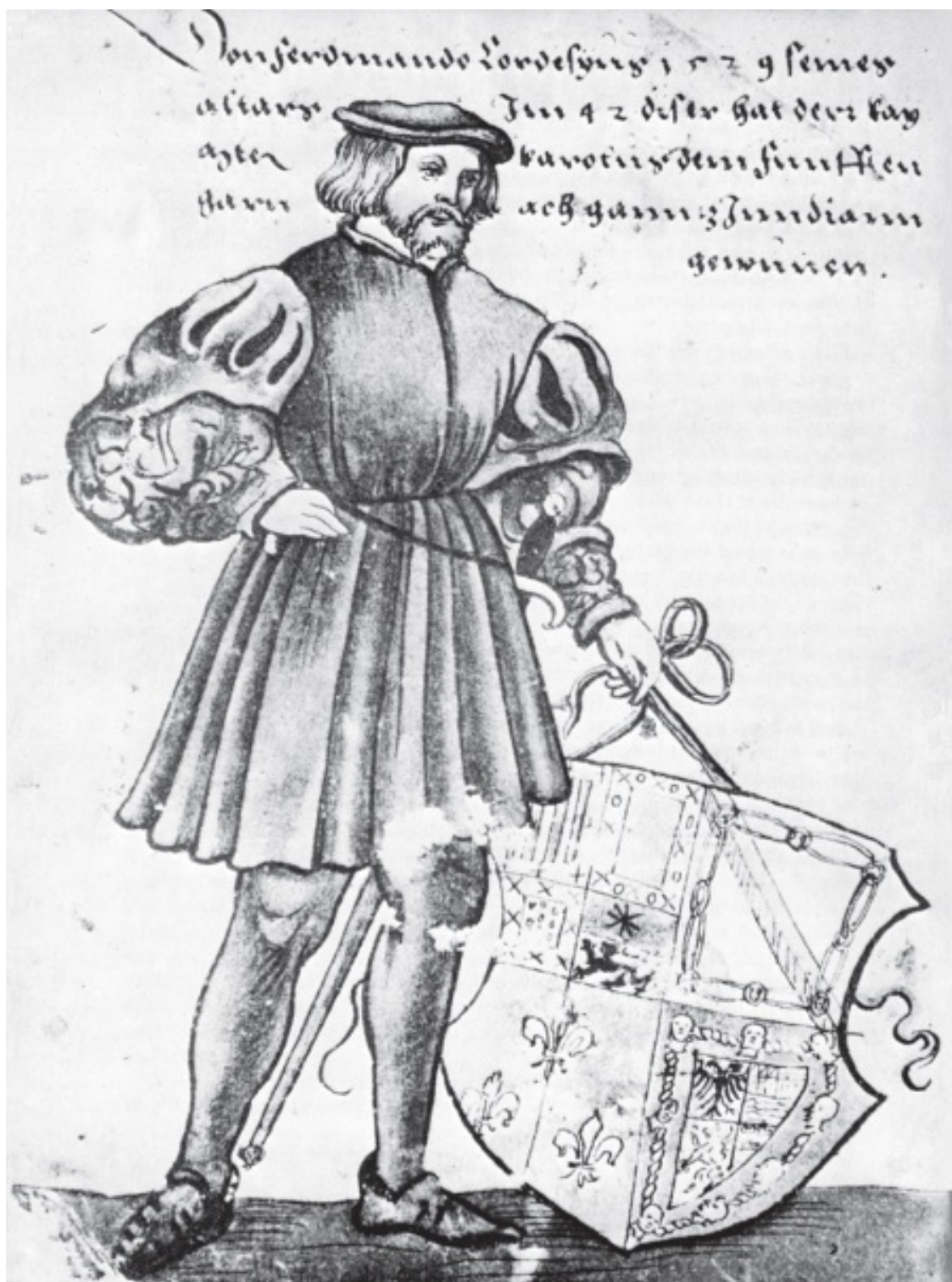
Эрнан Кортес. Вероятно, это наиболее достоверный портрет конкистадора; рисунок Вейдица, встречавшегося с ним позже в Испании