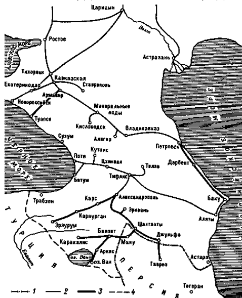
Схема железных дорог Кавказского района: 1 – государственная граница до 1917 г.; 2 – дороги, построенные до 1900 г.; 3 – дороги, построенные в 1900–1917 гг.; 4 – линия фронта во время Первой мировой войны.

Экономический и культурный подъем в Карсе пришелся на 1907–1917 гг. Население города к 1917 г. составляло 37 тысяч человек. Функционировало двенадцать церквей (русских, греческих и армянских), шесть мечетей, десять библиотек, один театр и два кинотеатра.