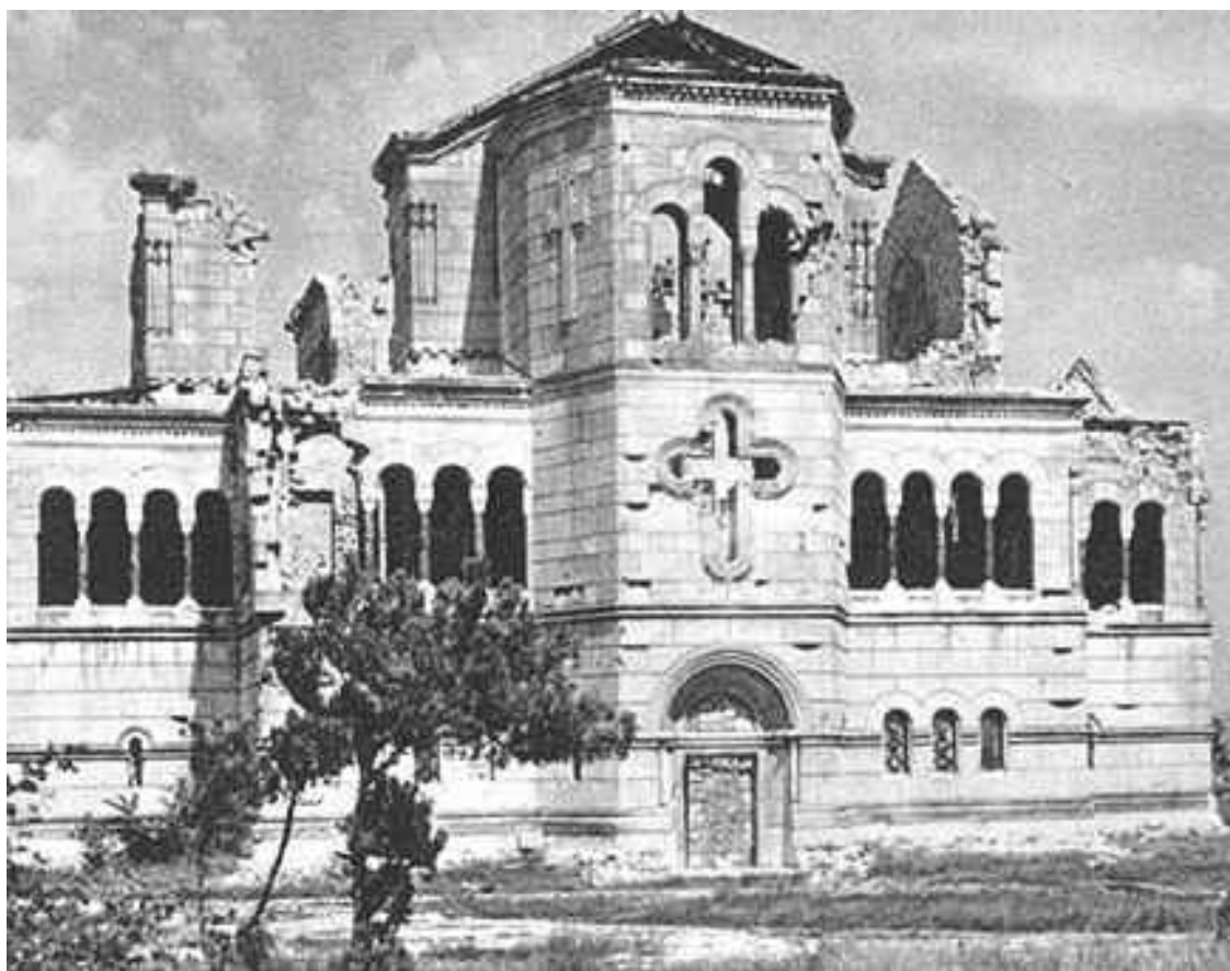
Собор Святого Владимира

В первой половине XIII века Причерноморье захватили турки-сельджуки. В 1223 году первый набег на полуостров совершили орды хана Батыея, и Херсонес фактически оказался наедине с врагом. Стремительно теряя влияние, город начал уступать генуэзцам, сумевшим переместить главные торговые пути в свои владения. Итальянские торговцы контролировали город, но вернуть ему былое могущество не смогли даже с помощью населения.