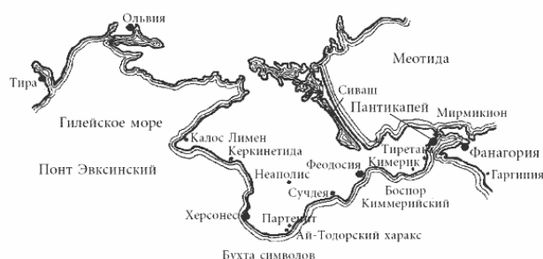
Карта древнего Крыма

В силу природных и географических особенностей Крым стал своеобразным местом встречи различных культур. В разные времена его населяли эллины, иранцы, иудеи, скифы, генуэзцы, армяне, татары, русские. Античные авторы называли «большой и весьма замечательный» полуостров Таврикой по общему наименованию племен, обитавших в Крыму до прихода кочевников из среднеазиатских степей.