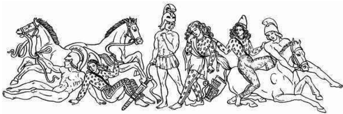
Эллины и амазонки