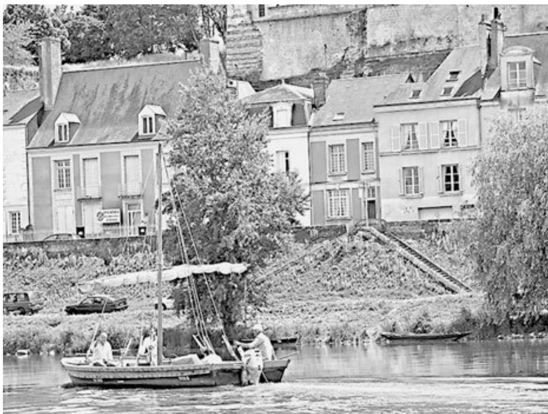
Замок Амбуаз, к которому мы подплываем