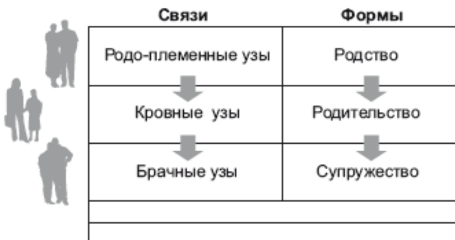
Рис. 1.1. Трансформация связующих и формообразующих основ брачно-семейных отношений

С психологической и этнографической точки зрения для семьи системообразующими являются брачно-семейные отношения.