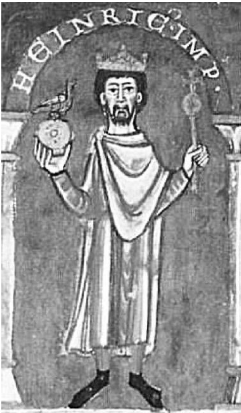
Император Генрих IV. Фрагмент миниатюры из Евангелия св. Эммерама. 1105/1106