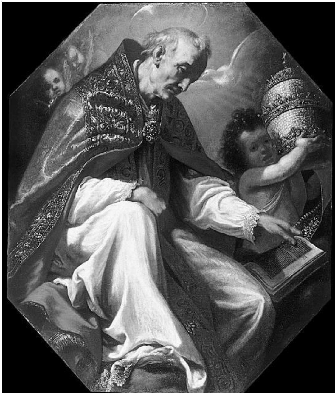
Якопо Виньяли. Св. Григорий Великий. Ок. 1630. Художественный музей Уолтерс, США

Вообще насильственное и принудительное крещение евреев в средневековой Европе как норма не практиковалось. Были более и менее массовые насильственные крещения в ходе погромов, когда евреи оказывались перед выбором: крещение или смерть, было принудительное обращение португальских евреев в христианство королем Мануэлом Счастливым уже на излете Средневековья, но эти случаи были исключительны и нелегитимны с точки зрения канонического права. Христианская церковь и вслед за ней монархи следовали принципу сохранения иудеев как таковых до второго пришествия как свидетелей истинности христианства; свидетельствовали они об этом как своим униженным положением, так и своим Писанием, то есть Ветхим Заветом, в котором христианские богословы видели множество указаний на Иисуса и его историю. Этот принцип сформулировал влиятельнейший отец церкви Августин Аврелий, комментируя библейский стих «Не умерщвляй их, чтобы не забыл народ мой» (Пс 58:12). Он