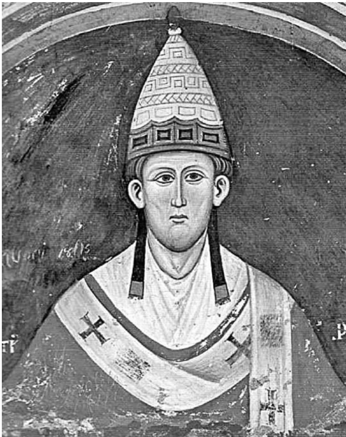
Папа Иннокентий III. Фреска из Аббатства св. схоластики. Ок. 1219

Но пока обращения и единения не произошло, понтифик тревожился, как бы иноверцы не причинили ущерб христианской вере и церкви. Это выразилось в добавлении ограничительной «поправки» к защитительной в целом конституции о евреях («чтобы только те были ограждены защитой сего покровительства, кто не лелеет помыслы о подрыве христианской веры») и в ряде канонов созданного им в 1215 году IV Латеранского собора. Помимо принятия учения о пресуществлении, осуждения ересей и других постановлений собор издал четыре важных канона о евреях и их крещеных братьях; один из них касался и других иноверцев в христианской Европе – мусульман.