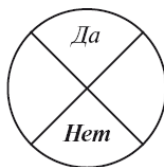
Рис. 4. Работа со словом «Нет»

Этап 4. Если соглашение со словом «ДА» достигнуто, можно продолжить далее все те же действия со словом «НЕТ» (см. рис. 4).