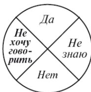
Рис. 6. Работа со словами «Не хочу говорить»

Возможно, это будет качание по противоположной диагонали или другое движение. Следите за маятником, Подсознание «подумает» и покажет. Это движение также надо запомнить раз и навсегда.