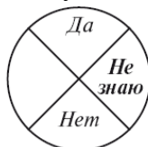
Рис. 5. Работа со словами «Не знаю»

– Какое движение означает для меня «Не знаю»? Маятник покажет что-то. Возможно, это будет качание по диагонали, но может выбрать для вас лично и что-то другое. Запомните его тотчас же, можете даже зарисовать, потому что впредь уже нельзя будет менять.