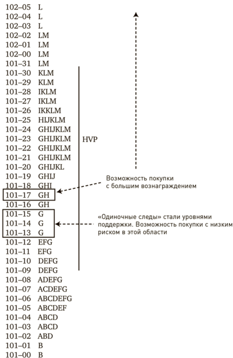
Рис. В. 4. День с двойным распределением

Правила «Профиля рынка» гласили, что «если рынок формирует день с двойным распределением, то рынок должен оставить после себя след из одиночных букв. Если этого не произошло, то это не был день с двойным распределением и, следовательно, не следует ожидать дальнейшего момента в направлении прорыва». (Вспомните правило «Если... то».)