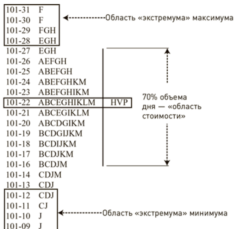
Рис. В. 1. День с нормальным распределением

Типы трейдеров. Во время торговых дней с нормальным распределением средний трейдер торгует в основном примерно в середине области стоимости, немного выигрывая и немного проигрывая – как правило, работая в ноль. Мой наставник как-то назвал таковых трейдерами «из дядюшкиной фирмы». Он объяснил это тем, что их нельзя уволить из-за кровного родства. Однако это же родство является причиной, по которой они не могут расти в должности внутри фирмы.